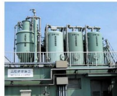
砂ろ過装置・活性炭吸着塔

浸出液処理施設の処理能力は、管理型区画1460m 3 /日、安定型区画300m 3 /日の合計1760m 3 /日です。