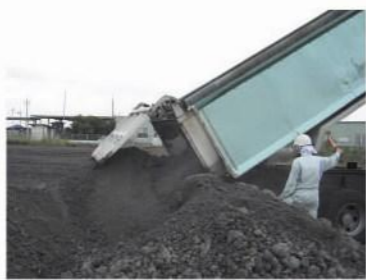
埋立作業時の検査の様子

廃棄物は日々発生し続けます。近年は環境保全意識の高まりから、リサイクルによる減量や焼却処理などによる減容化、無害化への取り組みも進んでいますが、汚泥や鉱さい、燃え殻など、どうしても埋立処分せざるを得ないものが残ります。また、廃棄物の最終処分場は、一部の不適正処理などに対する不信感や適地の減少などの理由から立地が年々困難になっています。そのため、既存処分場での受け入れ可能容量は残り少なく、公共関与によって早急に最終処分場を整備する必要があります。